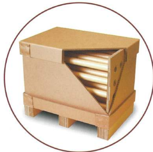
▲ロール集合包装用